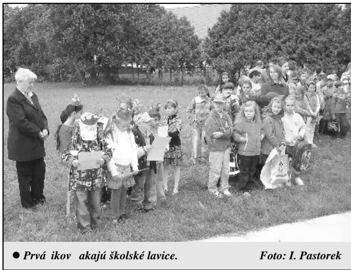
● Prvá ikov akajú školské lavice.

V školskom roku 2010/2011 bude ZŠ navštevova 102 žiakov v 4 triedach I. stup a a v 5 triedach II. stup a. MŠ bude v tomto školskom roku navštevova 32 detí. Budú pracova v dvoch triedach. Jedna trieda bude otvorená s celodennou prevádzkou a druhá s poldennou prevádzkou. Školský klub detí bude pracova v dvoch oddeleniach a bude ho navštevova 30 žiakov. Stravovanie žiakov zo ZŠ aj z MŠ a tiež všetkých zamestnancov školy je zabezpe ené v školskej jedálni.