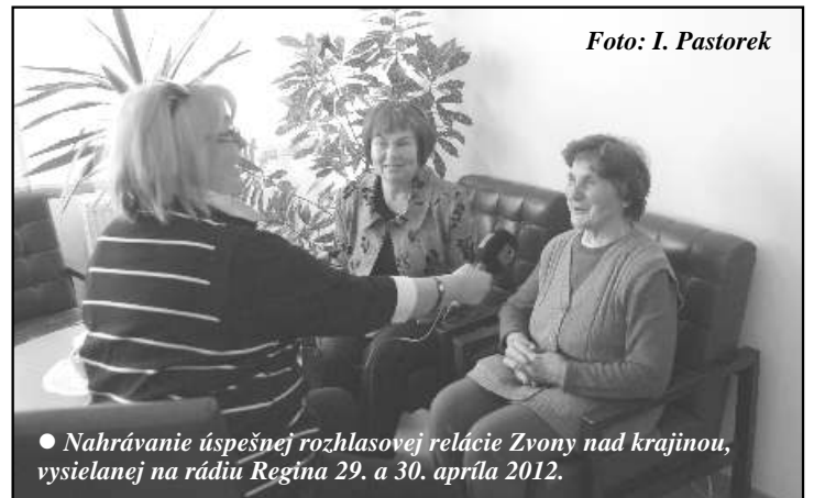
• Nahrávanie úspešnej rozhlasovej relácie Zvony nad krajinou, vysielanej na rádiu Regína 29. a 30. apríla 2012.