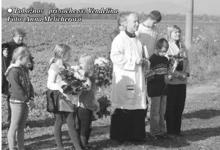
○ Pobožnosť pri soche sv. Vendelína

V závere pobožnosti, deti na znak úcty a vďaka k svätému Vendelínovi, položili k jeho soche kvety.