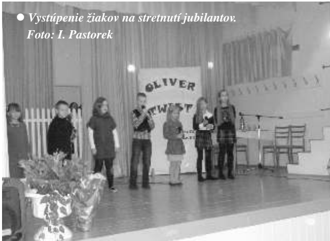
• Vystúpenie žiakov na stretnutí jubilantov.