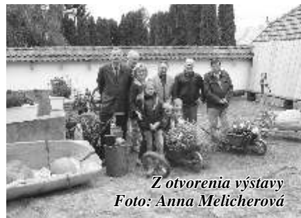
Z otvorenia výstavy