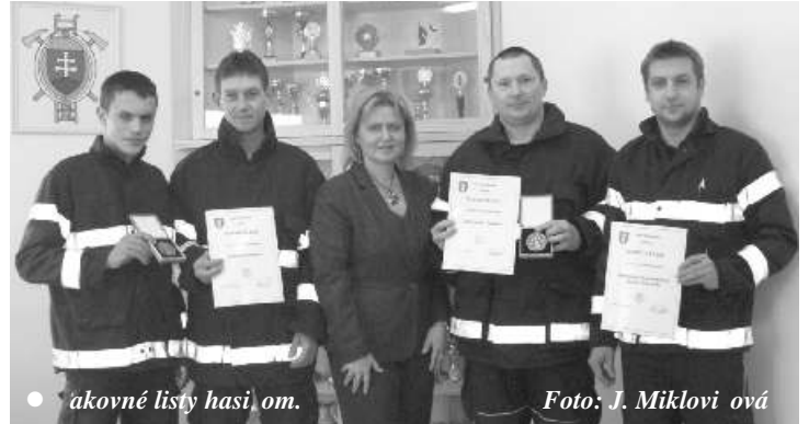
● akovné listy hasičom.