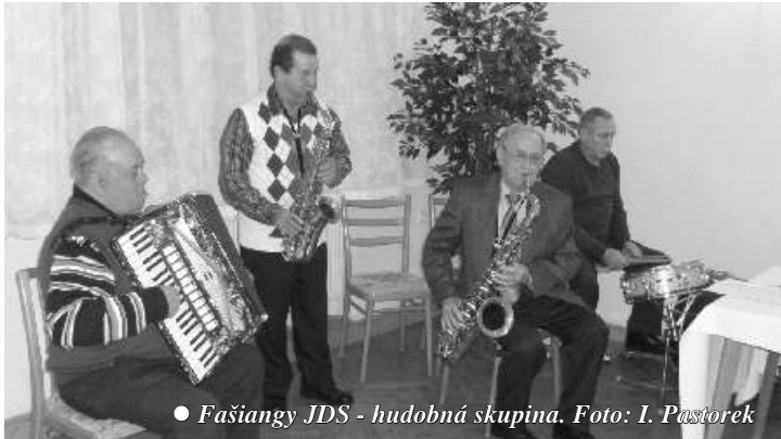
● Fašiangy JDS - hudobná skupina.

Vo fašiangový večer sa dňa 10. februára 2013 zišli členovia Základnej organizácie Jednoty dôchodcov na Slovensku v Pobeďime, aby prerokovali zásadné materiály organizácie na výročnej a zároveň volebnej schôdzi. Odsúhlasili plán, vyhodnotenie činnosti organizácie za predchádzajúci rok, hospodárenie ako aj