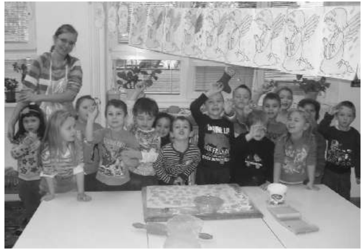
• Pečenie koláčov v zakúpenej rúre - využitie 1. miesta v projekte Hovoríme o jedle...