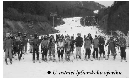
● Účastníci lyžiarskeho výcviku