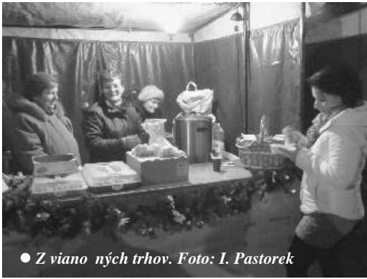
● Z vianočných trhov.