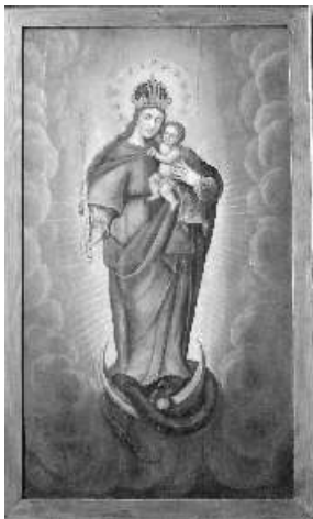
● Obraz Panny Márie v súčasnosti nálezu ako police knižnice a po reštaurovaní.