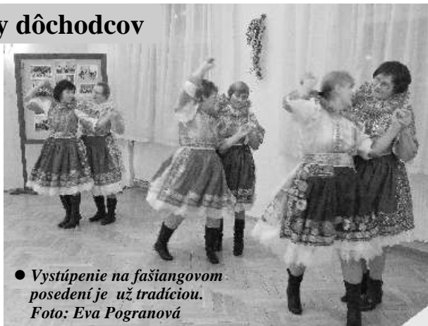
● Vystúpenie na fašiangovom posedení je už tradíciou.

V prvom vystúpení vynikli krásy nášho kroja, zvýraznené tancom na modernú hudbu. Skutočne prekvapivé bolo vystúpenie spomínaného zahraničného súboru konkrétne skupiny Maxim Turbulenc v podaní našich leniek a pod režijným vedením Jarmily Mašanovej. Dá sa konštatovať, že vystúpenie cvičieniek bolo príjemné, krojovaných leniek pekné a trocha dámy (Maxim Turbulenc) vtipné a originálne. Na posedení