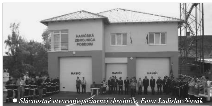
● Slávnostné otvorenie požiarnej zbrojnice.

V období 2010 - 2014 sa pokračovalo v rekonštrukcii požiarnej zbrojnice, ktorá sa dokon ila a slávnostne odovzdala do užívania a posvätila. Projekt bol