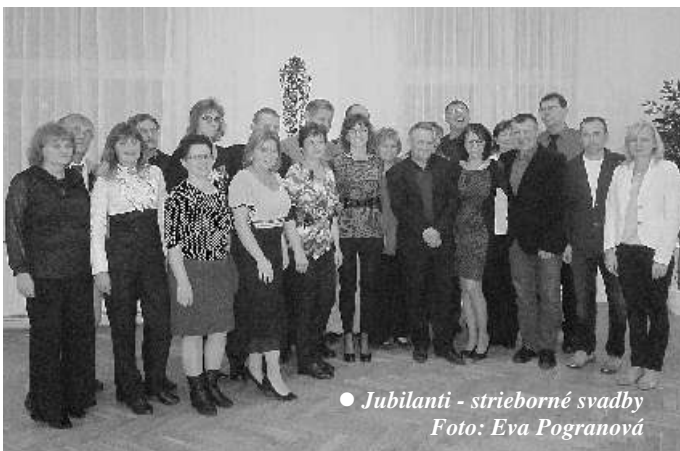
● Jubilanti - strieborné svadby