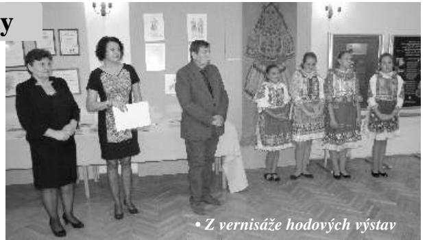
• Z vernisáže hodových výstav

Na záver treba pripomenú , že práve v nede u,