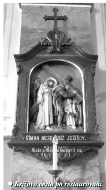
● Krížová cesta po reštaurovaní