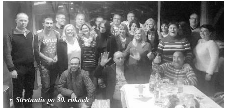
• Stretnutie po 30. rokoch