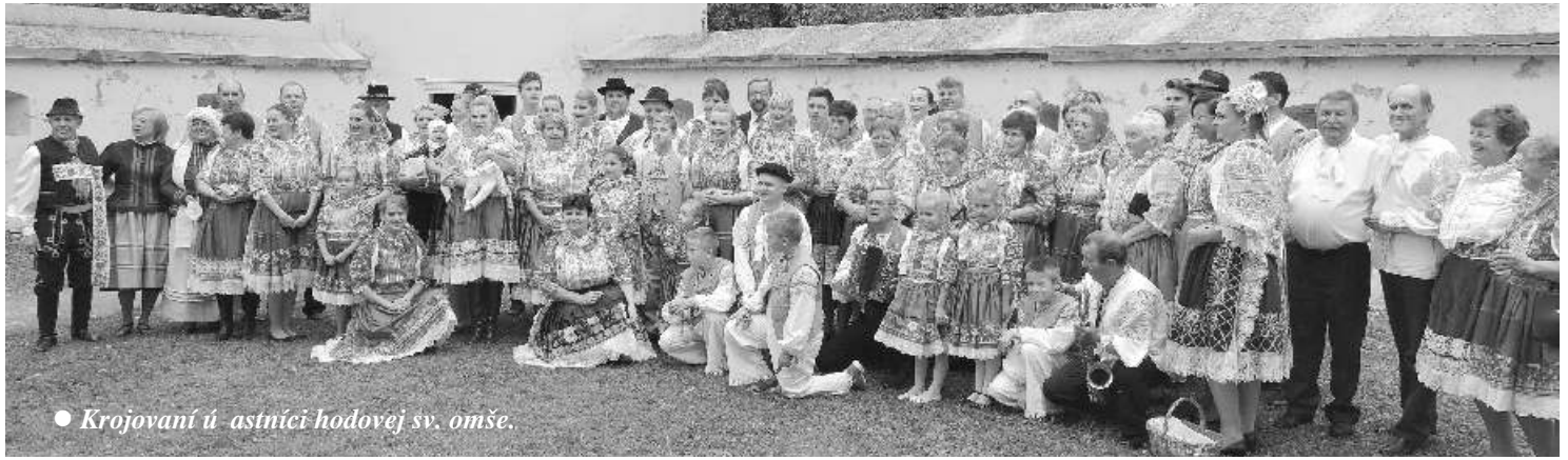
● Krojovaní ú astníci-hodovej sv. omše.