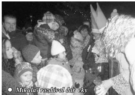
• Mikuláš rozdával darčeky