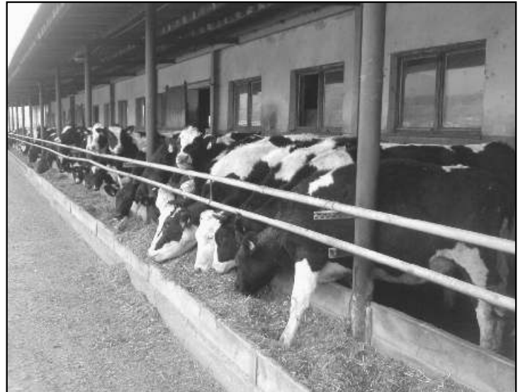
● Chov hovädzieho dobyťka.