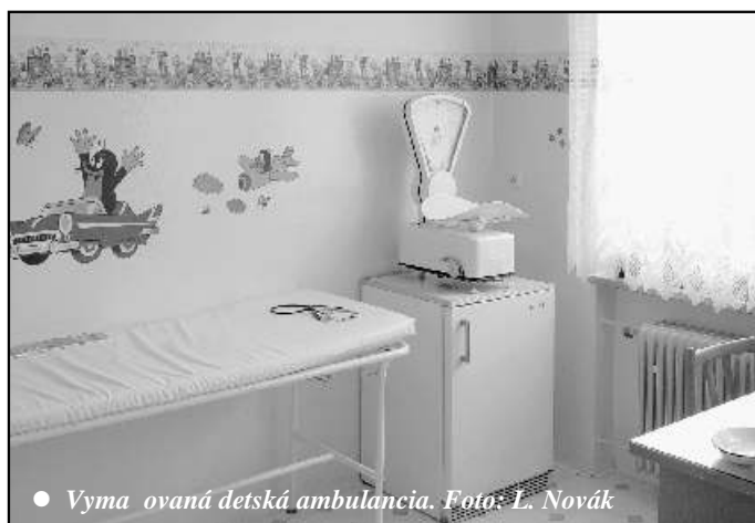
• Vymaňovaná detská ambulancia.