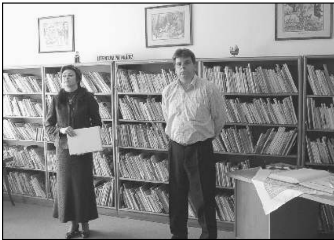
● Pred rokom bola knižnica sprístupnená v nových priestoroch.

Obecná knižnica Jána Hollého v nových podmienkach pracuje a možno povedať, že sa jej celkom darí. Nové priestory sa otvárajú a návštevníkom knižnice páčia. Sú čisté, svetlé, priestrané. V príjemnom prostredí sa knihy dobre vyberajú. To hovorím v mene čitateľov, ktorí knižnicu navštevujú.