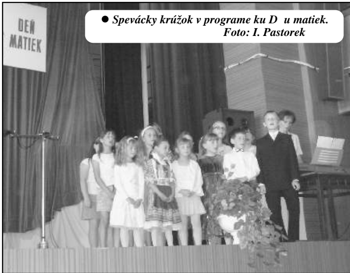
● Spevácky krúžok v programe ku D u matiek.