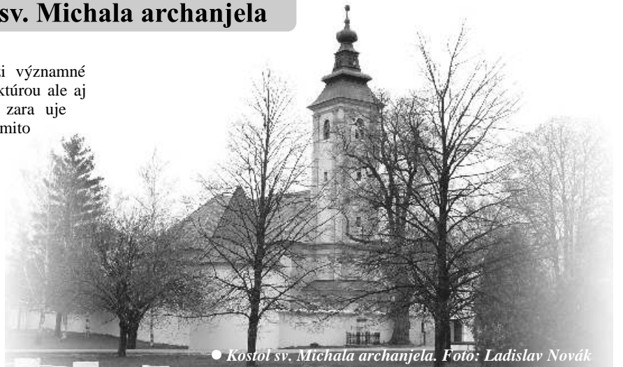
• Kostol sv. Michala archanjela.