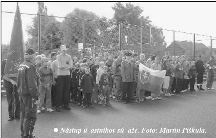
• Nástup účastníkov súťaže.

Konali sa tiež preteký jazde na motokárách a tréning na alpsku súťaž, ktorá sa konala v obci Teplá okres Karlové Vary a navštívili sme aj Karlové Vary. Ďalšou hasičskou stanicou, ktorú sme navštívili bola stanica v Moste a po exkurzii sme navštívili aquapark v tomto meste.