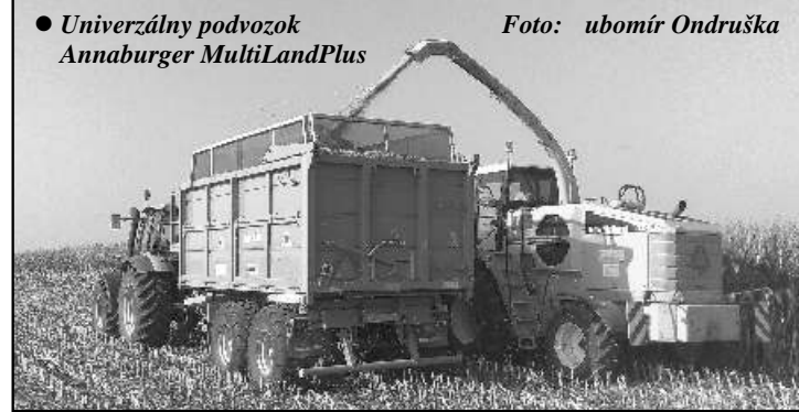
● Univerzálny podvozok Annaburger MultiLandPlus

V tomto roku sme znovu dali zelenú modernizácii družstva a ešte do budúcej budúcej seby jačmeňa a sme zakúpili minimalizáciu sejačky ku HORSCH PRONTO DC 4 so štvormetrovým záberom. Okamžite k tomu bola zakúpená dvojmontáž na zadné kolá traktora, aby prítlak na pôdu pred sejbou bol čo najmenší. Pred prvou kosbou lucerky bola zakúpená nová kosačka na krmoviny