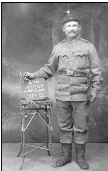
● Pamiatka na zajatie v Rusku.