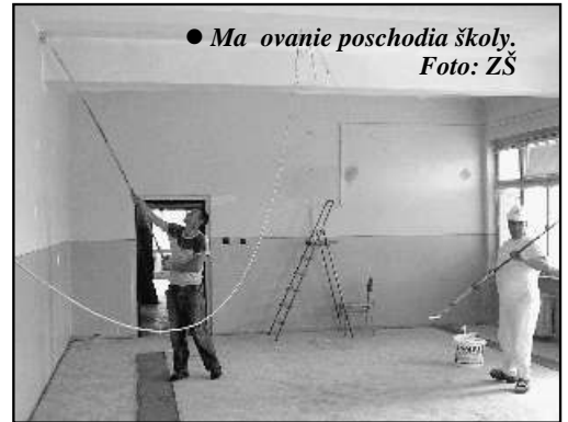
● Maľovanie poschodia školy.