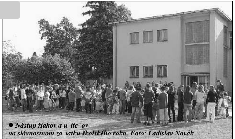
• Nástup žiakov a učiteľov na slávnostnom začiatku školského roka.