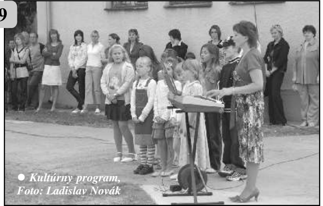
● Kultúrny program