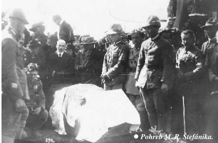
● Pohreb M. R. Štefánika.

Pochádzal z roľníckej rodiny, bol v poradí druhý z piatich detí. Po skončení základnej školy v Pobeďime bol vybraný na štúdium do Kromčíc, kde absolvoval Zemědělskou poľnohospodársku školu, ktorú úspešne ukončil v roku 1909. O rok neskôr nastúpil základnú vojenskú službu do Bratislavy. Bol účasťou I. svetovej vojny. Slúžil v rakúsko - uhorskej armáde a od 21. mája 1916 bol odvelený na frontovú líniu do Talianska. Od roku 1918 do konca roku 1919 vykonával vojenskú službu v československých légiách v Taliansku. Ako poručík v zálohe obdržal od Ministerstva obrany Talianskej republiky vojenské ocenenie. Naposledy bol povýšený v roku 1944 do hodnosti stotníka pechoty v zálohe.