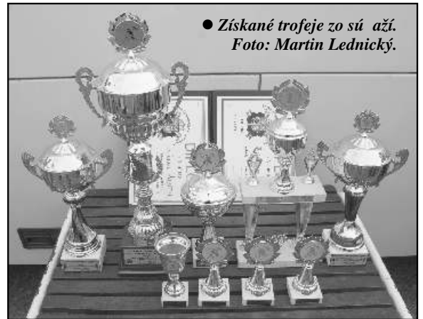
• Získané trofeje zo súťaže.

V programe nechýbala ani návšteva kúpeľov Mariánske Lázně s prehliadkou spievajúcej fontány.