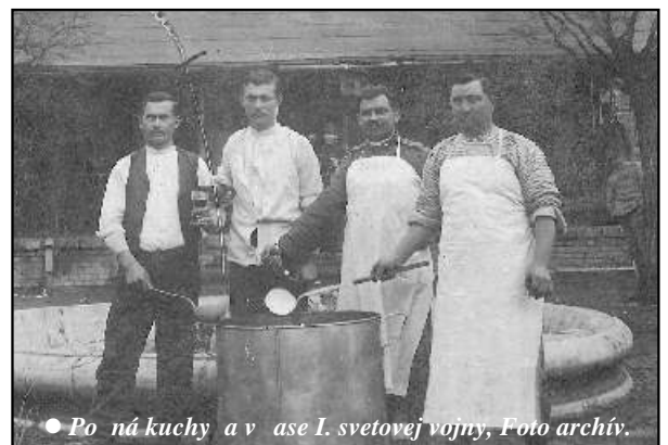
● Po kuchyňa v I. svetovej vojny, Foto archív.

Spomienkou na ich skončenie vo víre vojny je pamätník padlým Pobeďimčanom a obyvateľom Bašoviev v areáli kostola sv. Michala. Pomník kameň a v hornej časti