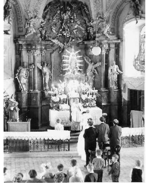
Hlavný oltár kostola na archívnej fotografii.