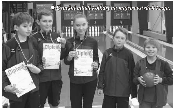
• Úspešní mladí kolkári na majstrovstvách kraja.