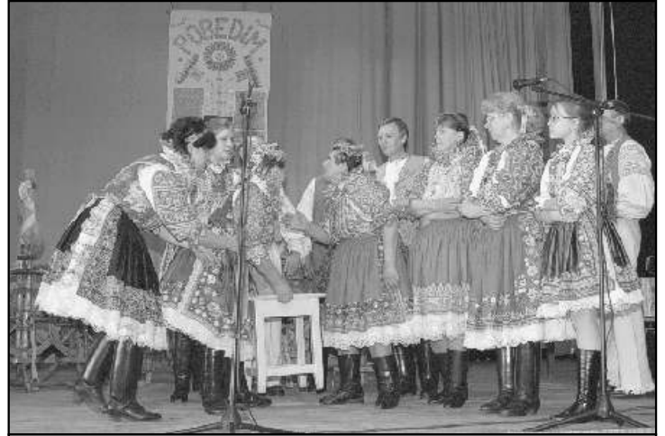
● Z jubilejného vystúpenia folklórnej skupiny.