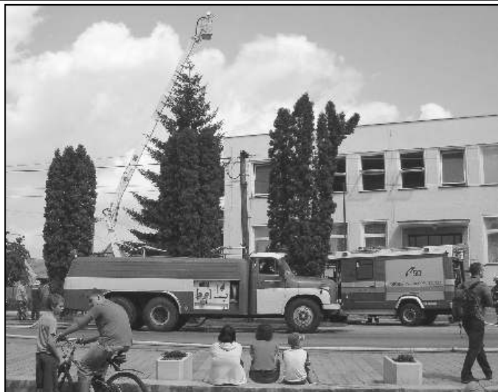
• Moderná hasičská technika na cvičení.