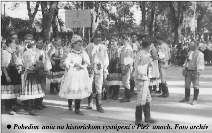
● Pobeďimania na historickom vystúpení v Piešaniach.