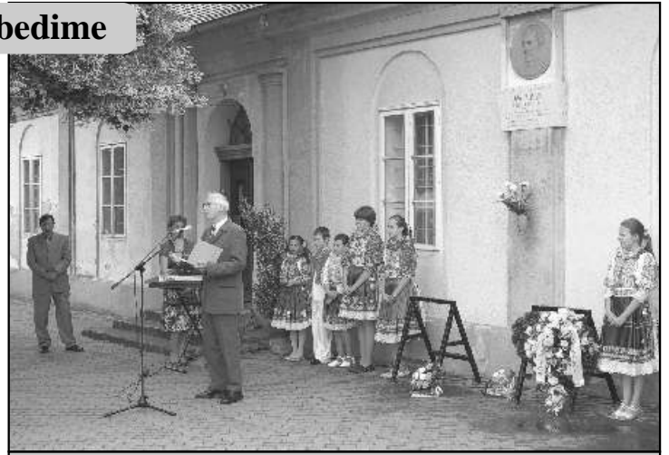
● Spomienková oslava pri pamätnej tabuli.

Spomienková oslava okrúhleho výročia pôsobenia básnika a kľáza Jána