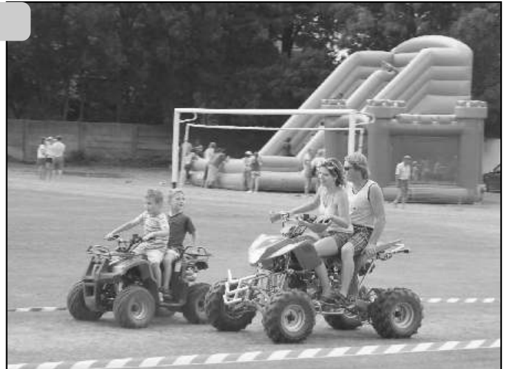
• Štvorkolky zaujali aj "ve ké deti". V pozadí nafukovacie atrakcie pre deti.

Futbalový turnaj bol napínavý s množstvom akcií, ktoré dvíhali fanúšikov z miest. Vyhrali tí najlepší, a ví azný tím získal sladkú odmenu, tortu.