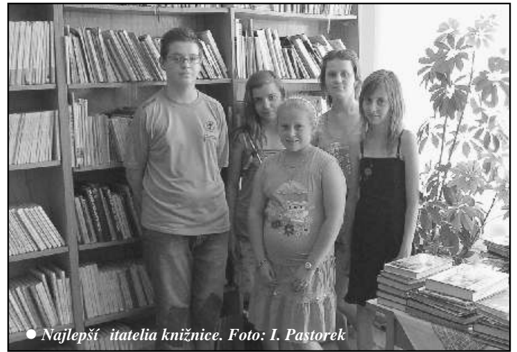
• Najlepši itatelia knižnice.