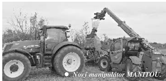
• Nový manipulátor MANITOU.

Potrípili nás aj poruchy strojov. Na ve - kom traktore sa prejavili ažké jesenné podmienky roku 2020. V servise nám museli urobi generálku motora. Viackrát nám na om popraskali hydraulické hadice a ventily. Kombajny, ktoré sme mali na službách, tiež nezostali bez porúch. Na ve kom diská i sa nám zlomilo oje. Ve a porúch sme mali na